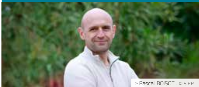
> Pascal BOISOT · © S.P.P.