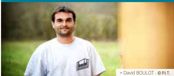
> David BOULOT · © P.I.T.