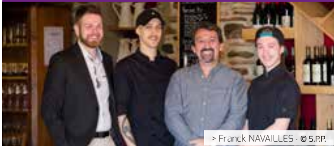
> Franck NAVAILLES · © S.P.P.