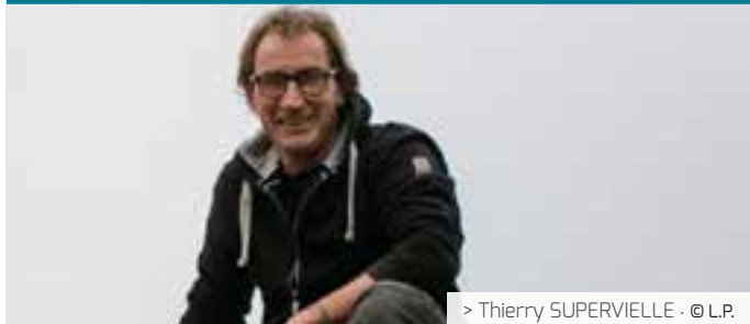
> Thierry SUPERVIELLE · © L.P.