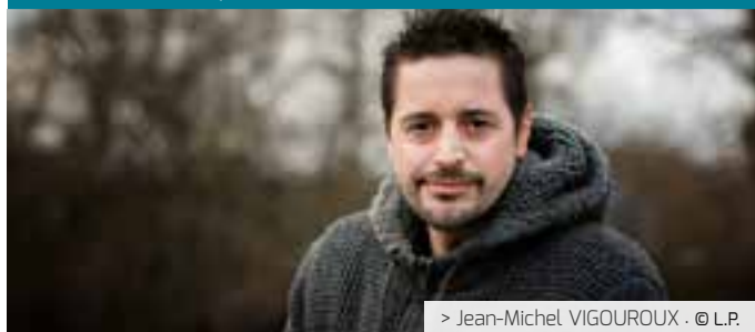
> Jean-Michel VIGOUROUX · © L.P.