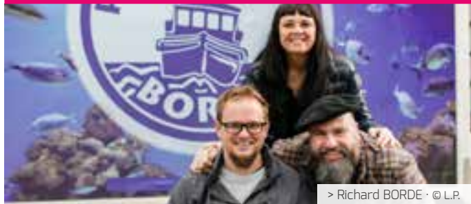
> Richard BORDE · © L.P.