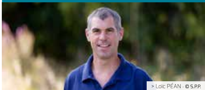
> Loïc PÉAN · © S.P.P.