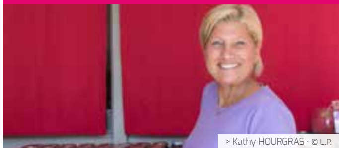
> Kathy HOURGRAS · © L.P.