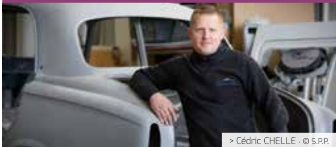
> Cédric CHELLE - © S.P.P.