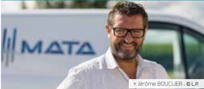
> Jérôme BOUCLIER - © L.P.