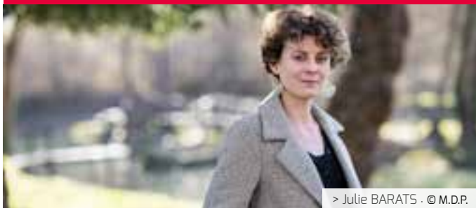
> Julie BARATS · © M.D.P.