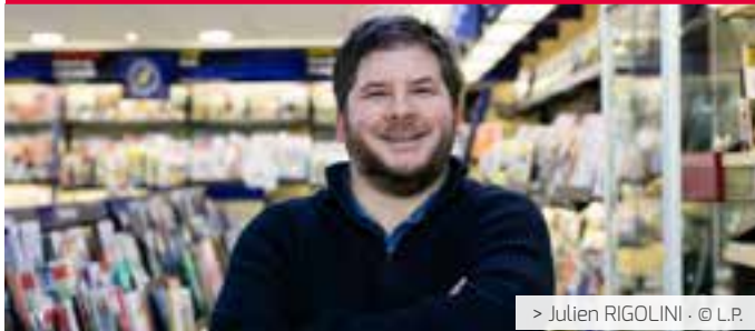
> Julien RIGOLINI · © L.P.