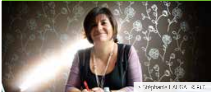
> Stéphanie LAUGA · © P.I.T.