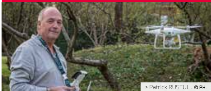
> Patrick RUSTUL · © PH.