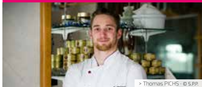
> Thomas PICHES · © S.P.P.