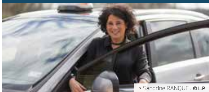
> Sandrine RANQUE · © L.P.