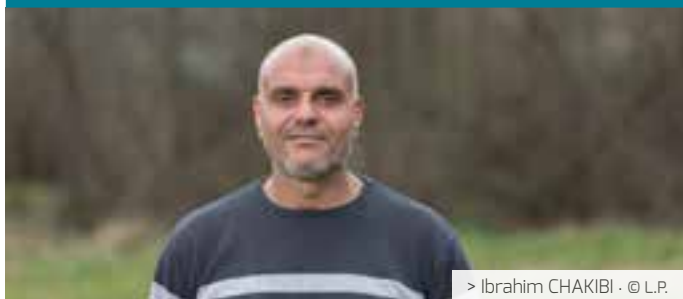
> Ibrahim CHAKIBI