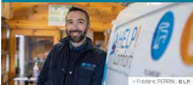
> Frédéric PERRIN · © L.P.