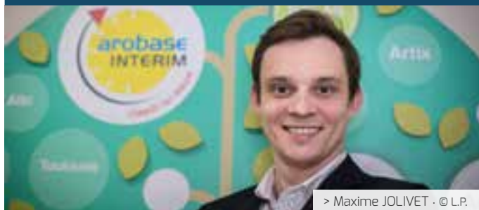
> Maxime JOLIVET · © L.P.