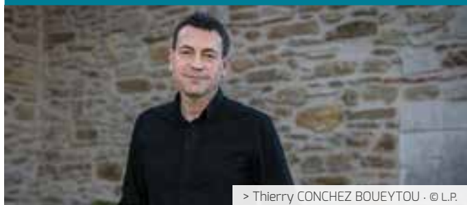
> Thierry CONCHEZ BOUEYTOU · © L.P.