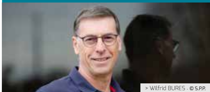
> Wilfrid BURES · © S.P.P.