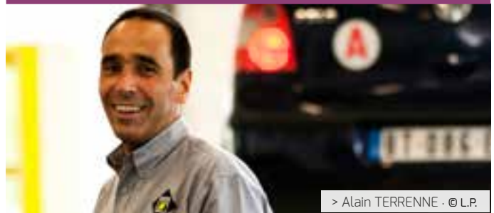
> Alain TERRENNE - © L.P.