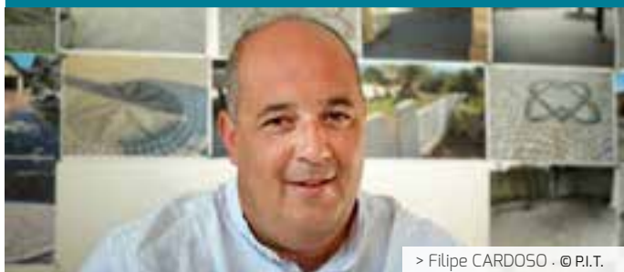
> Filipe CARDOSO · © P.I.T.