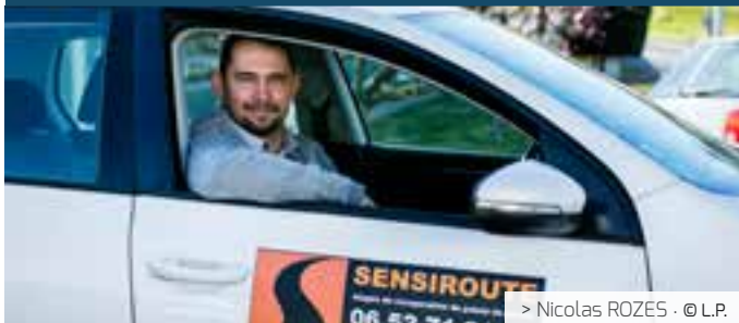
> Nicolas ROZES · © L.P.