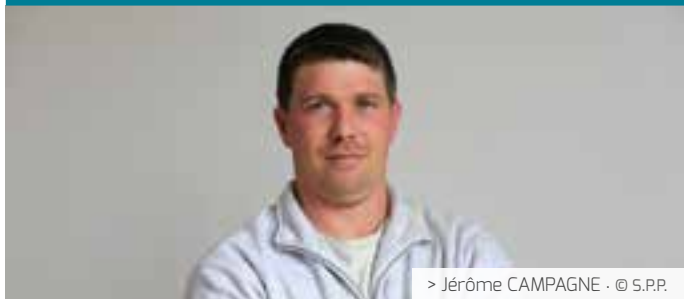
> Jérôme CAMPAGNE · © S.P.P.