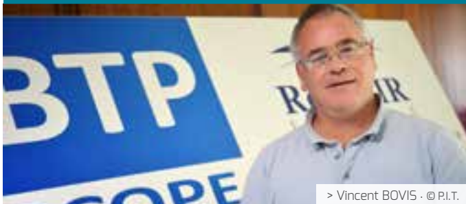
> Vincent BOVIS · © P.I.T.