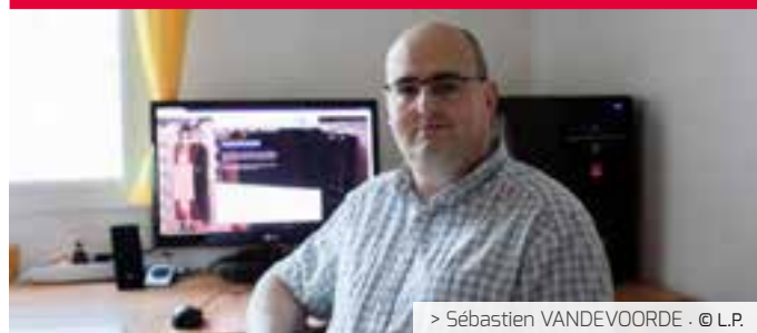
> Sébastien VANDEVOORDE - © L.P.