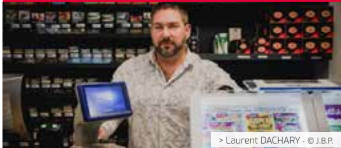
> Laurent DACHARY · © J.B.P.