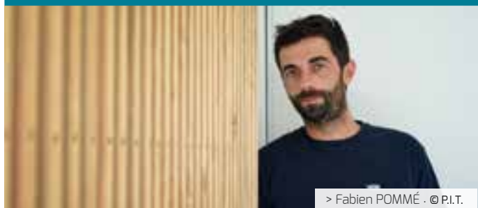
> Fabien POMMÉ · © P.I.T.