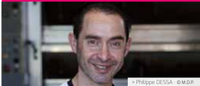
> Philippe DESSA · © M.D.P.