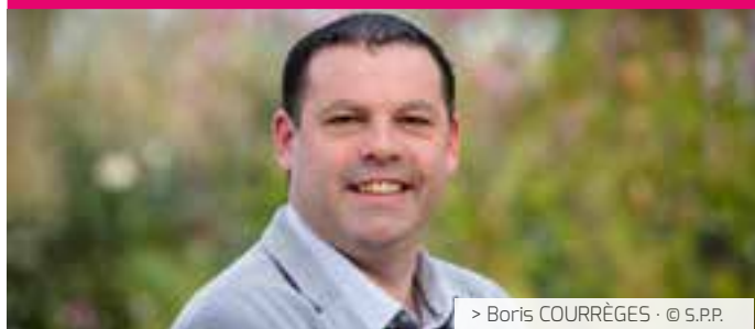
> Boris COURRÈGES · © S.P.P.