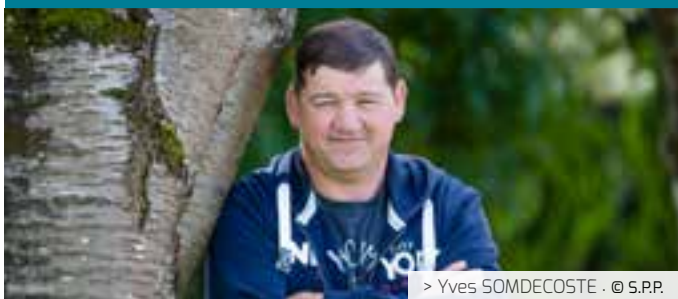
> Yves SOMDECOSTE · © S.P.P.