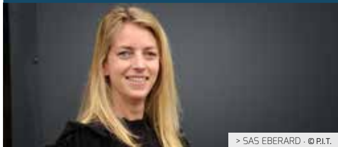
> SAS EBERARD · © P.I.T.