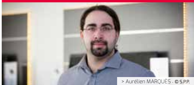
> Aurélien MARQUÉS - © S.P.P.