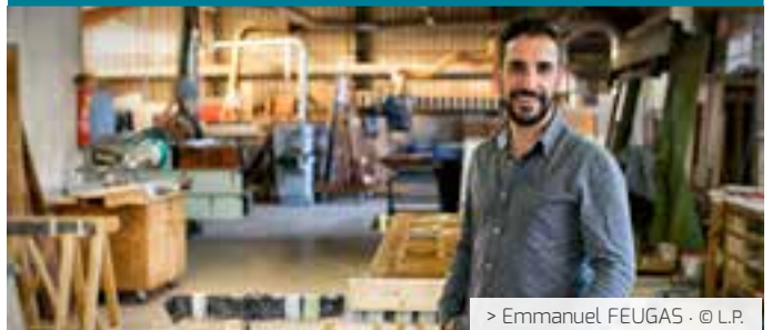
> Emmanuel FEUGAS · © L.P.