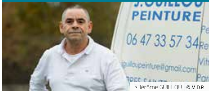
> Jérôme GUILLOU · © M.D.P.