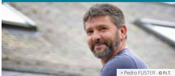
> Pedro FUSTER · © P.I.T.