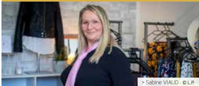
> Sabine VIAUD