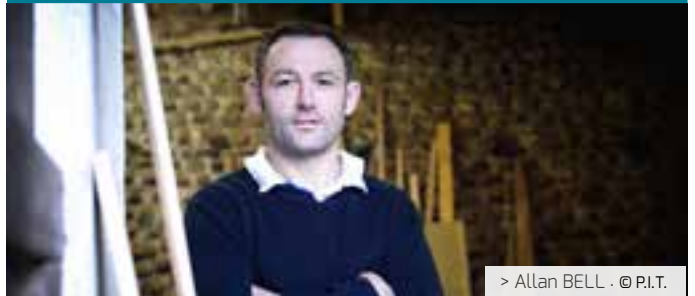
> Allan BELL · © P.I.T.