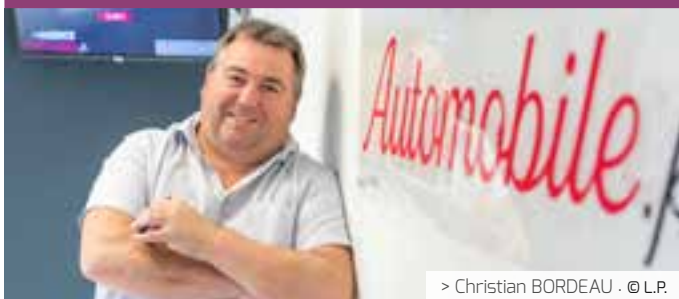
> Christian BORDEAU - © L.P.