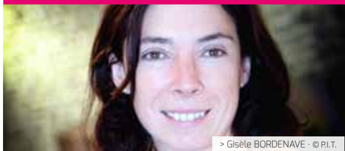
> Gisèle BORDENAVE · © P.I.T.