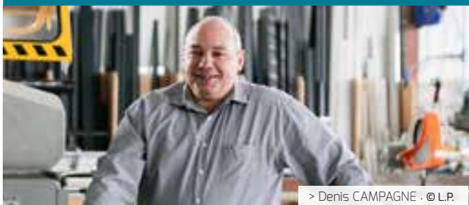
> Denis CAMPAGNE · © L.P.