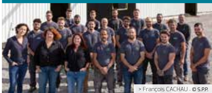
> François CACHAU · © S.P.P.