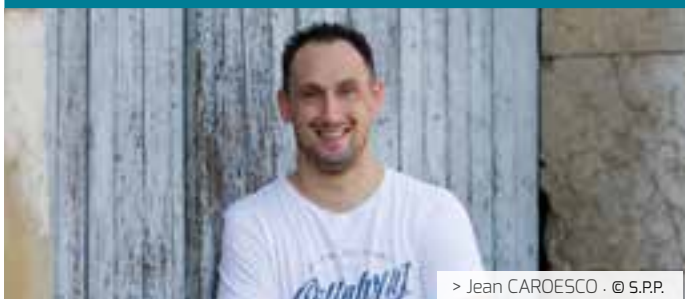
> Jean CAROESCO · © S.P.P.