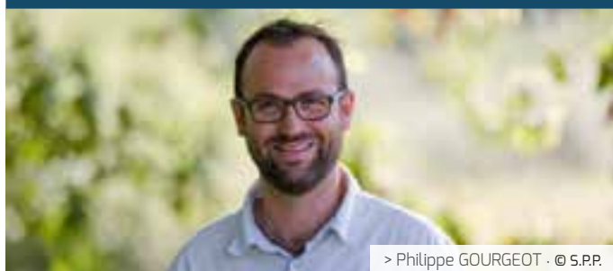
> Philippe GOURGEOT · © S.P.P.