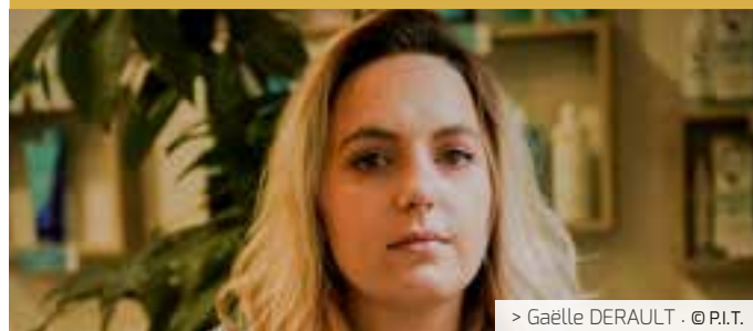
> Gaëlle DERAULT · © P.I.T.