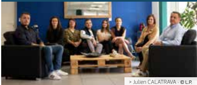
> Julien CALATRAVA · © L.P.