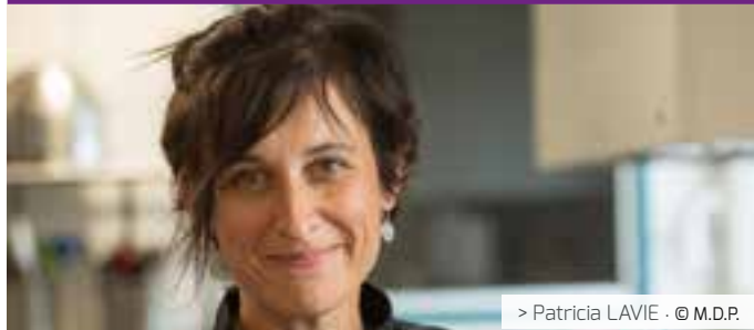
> Patricia LAVIE