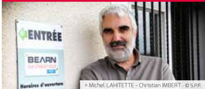
> Michel LAHITETTE - Christian IMBERT - © S.P.P.