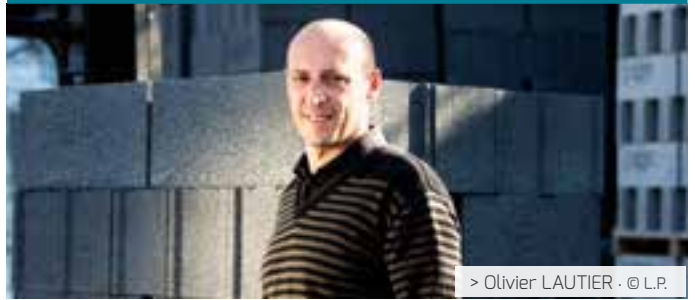
> Olivier LAUTIER · © L.P.