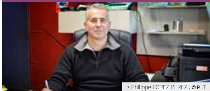
> Philippe LOPEZ PEREZ · © P.I.T.