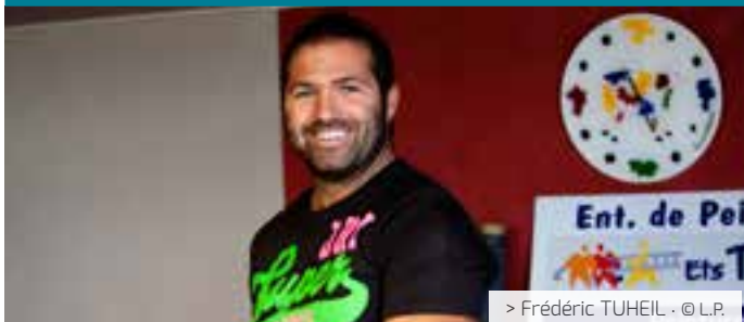
> Frédéric TUHEIL · © L.P.