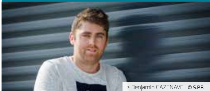
> Benjamin CAZENAVE · © S.P.P.