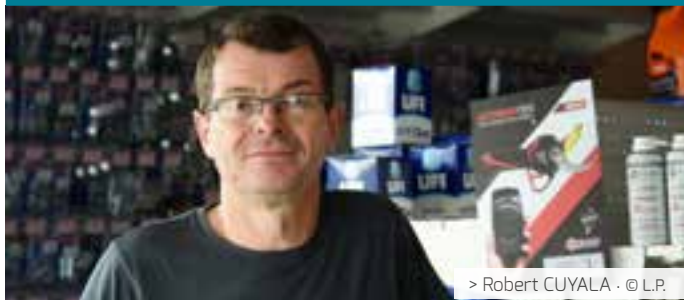
> Robert CUYALA · © L.P.