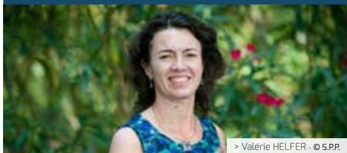
> Valérie HELFER · © S.P.P.