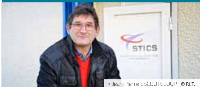
> Jean-Pierre ESCOUTELOUP · © P.I.T.