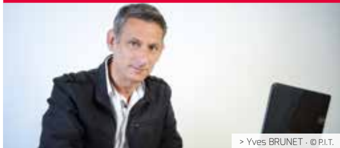
> Yves BRUNET - © P.I.T.