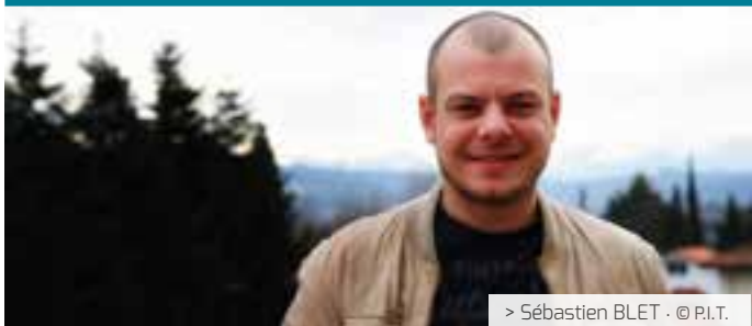
> Sébastien BLET · © P.I.T.