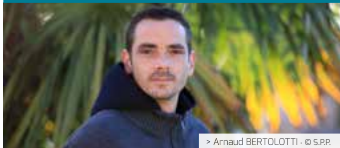
> Arnaud BERTOLOTTI · © S.P.P.