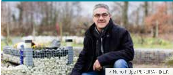
> Nuno Filipe PEREIRA