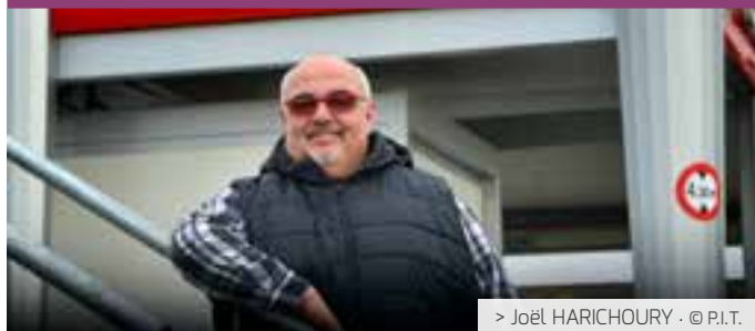
> Joël HARICHOURY