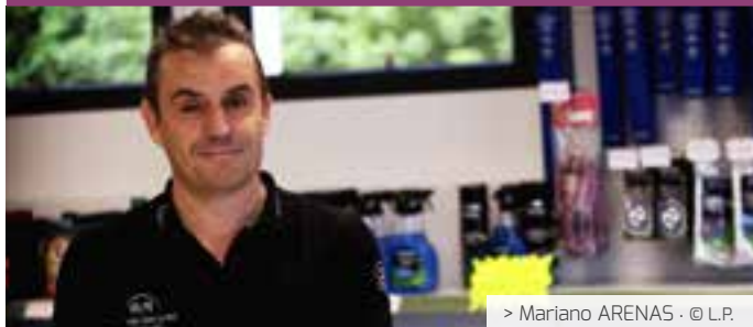
> Mariano ARENAS · © L.P.