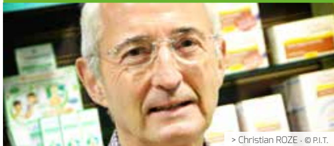
> Christian ROZE . © P.I.T.