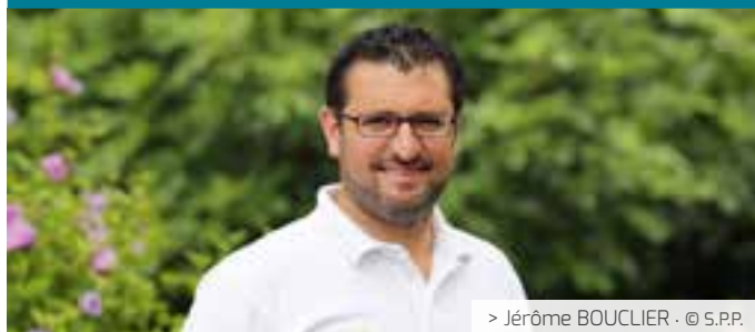
> Jérôme BOUCLIER · © S.P.P.