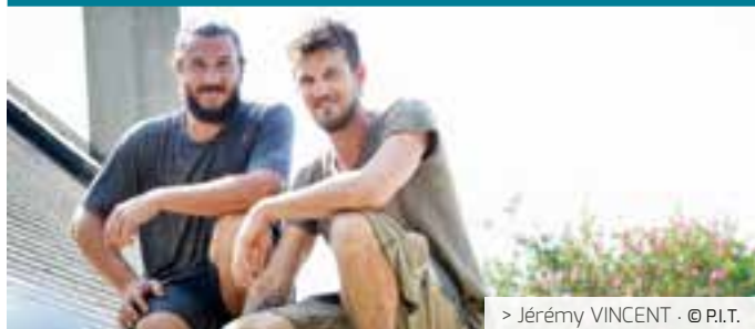
> Jérémy VINCENT · © P.I.T.