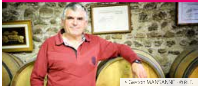
> Gaston MANSANNÉ