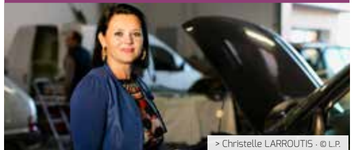
> Christelle LARROUTIS