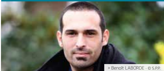
> Benoît LABORDE · © S.P.P.