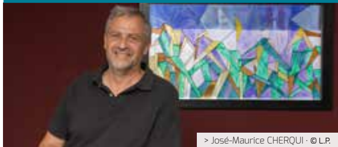
> José-Maurice CHERQUI · © L.P.