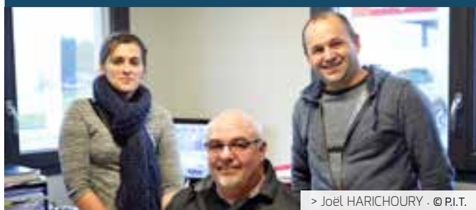
> Joël HARICHOURY