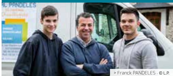
> Franck PANDELES · © L.P.