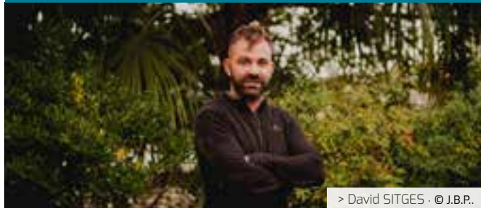
> David SITGES · © J.B.P.