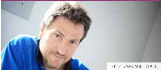
> Éric GAMBADE · © P.I.T.