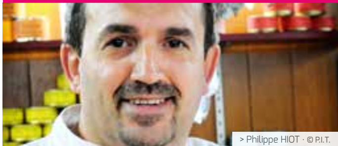
> Philippe HIOT · © P.I.T.