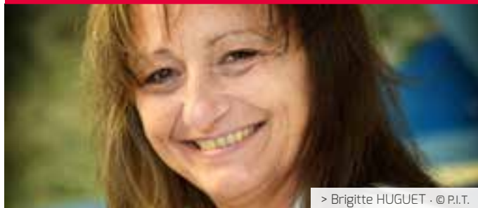
> Brigitte HUGUET - © P.I.T.