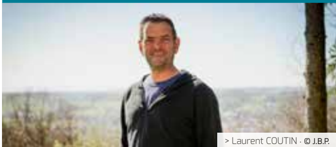
> Laurent COUTIN · © J.B.P.