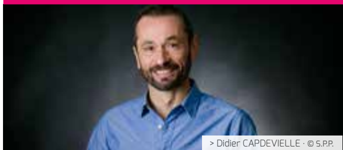
> Didier CAPDEVIELLE · © S.P.P.