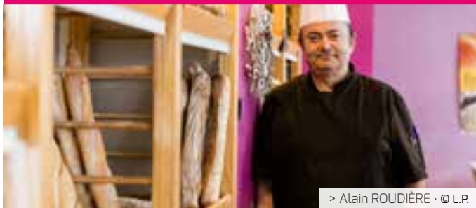
> Alain ROUDIÈRE · © L.P.