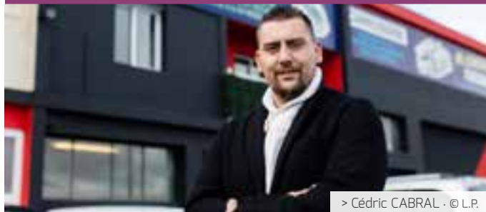
> Cédric CABRAL · © L.P.