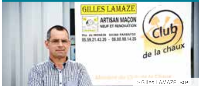
> Gilles LAMAZE · © P.I.T.