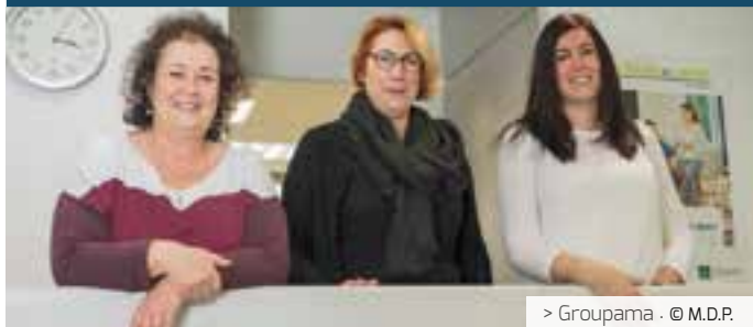
> Groupama · @ M.D.P.