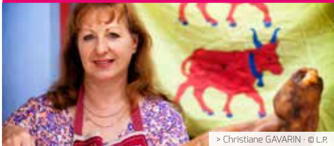
> Christiane GAVARIN