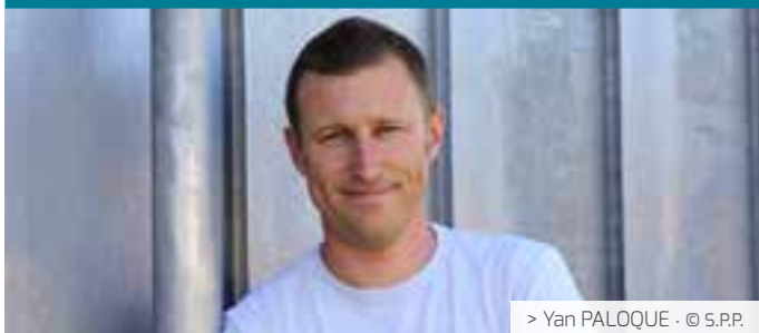
> Yan PALOQUE · © S.P.P.