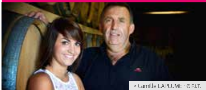
> Camille LAPLUME · © P.I.T.