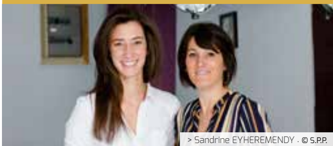
> Sandrine EYHEREMENDY · © S.P.P.