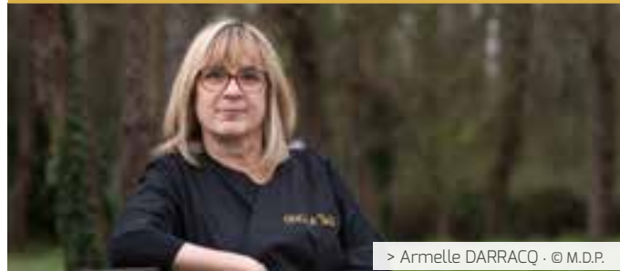
> Armelle DARRACO · © M.D.P.