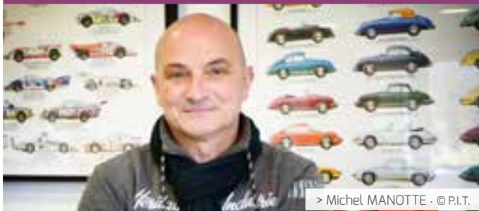
> Michel MANOTTE - © P.I.T.