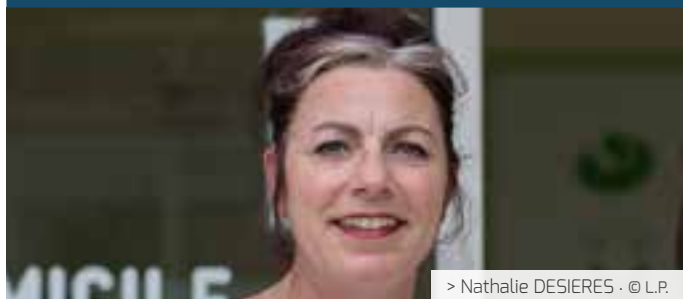
> Nathalie DESIERES · © L.P.