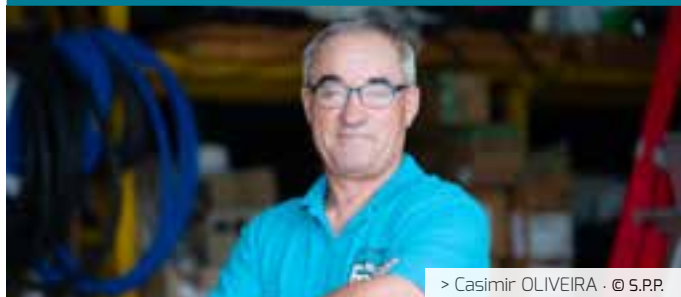
> Casimir OLIVEIRA · © S.P.P.