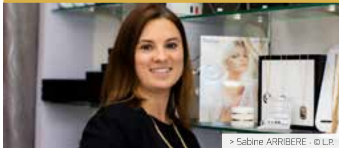
> Sabine ARRIBERE · © L.P.