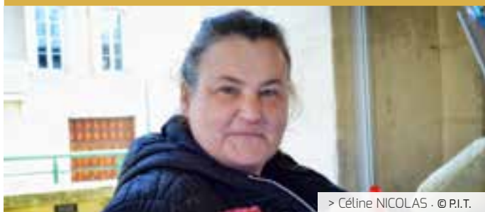
> Céline NICOLAS · © P.I.T.