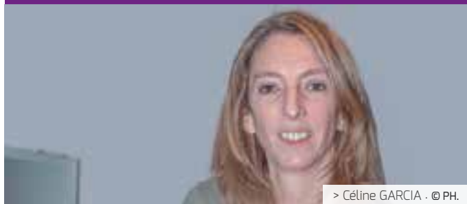
> Céline GARCIA · @ PH.