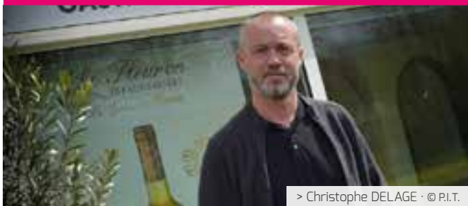
> Christophe DELAGE · © P.I.T.