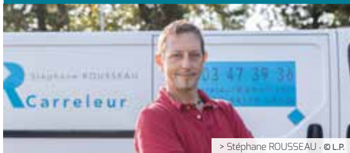
> Stéphane ROUSSEAU · © L.P.