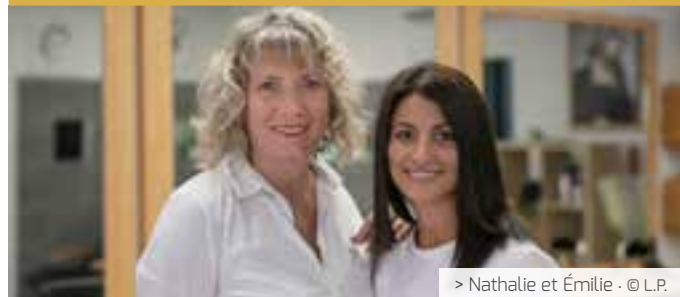
> Nathalie et Émilie · © L.P.