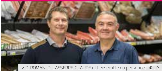
> D. ROMAN, D. LASSERRE-CLAUDE et l'ensemble du personnel