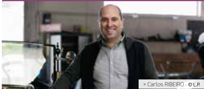
> Carlos RIBEIRO · © L.P.