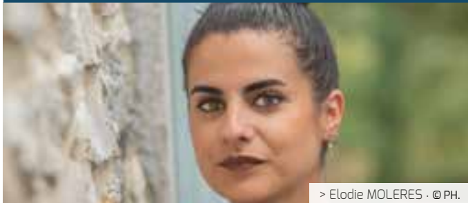
> Elodie MOLERES · © PH.