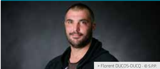
> Florent DUCOS-DUCQ - © S.P.P.