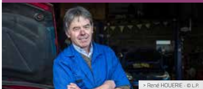
> René HOUERIE · © L.P.