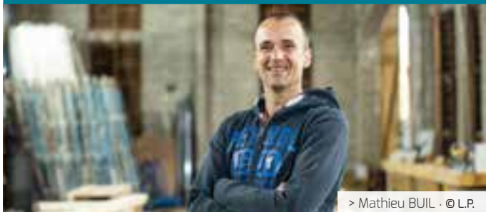
> Mathieu BUIL · © L.P.