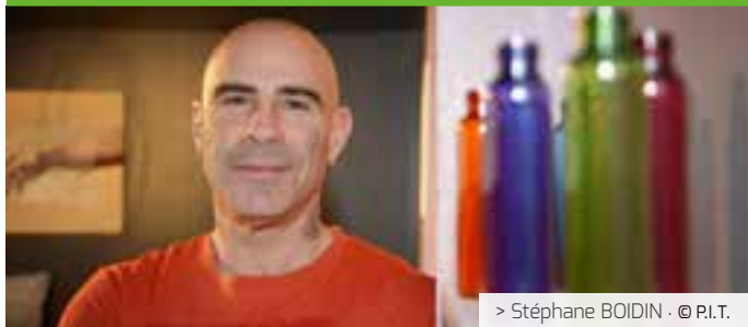
> Stéphane BOIDIN · © P.I.T.