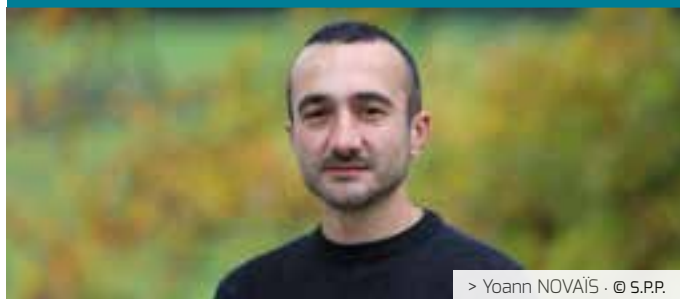
> Yoann NOVAÏS · © S.P.P.