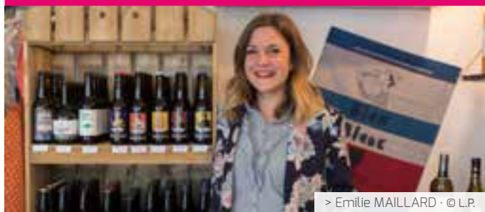
> Emilie MAILLARD · © L.P.