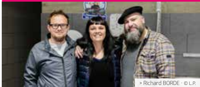
> Richard BORDE · © L.P.