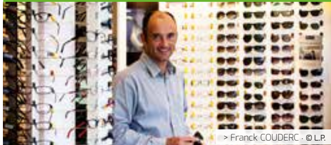
> Franck COUDERC . © L.P.