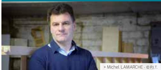
> Michel LAMARCHE · © P.I.T.