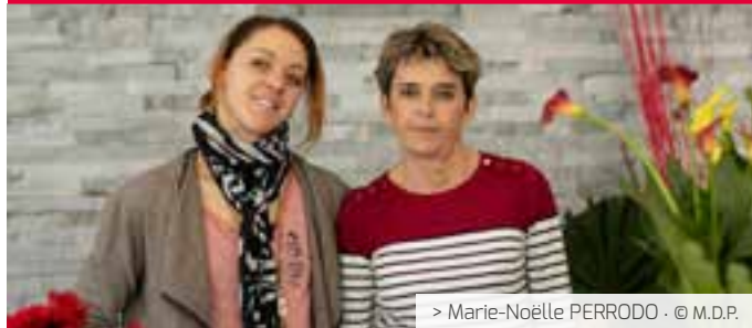
> Marie-Noëlle PERRODO